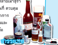
สารระเหย

สารระเหยเป็นของเหลว ส่วนมากจะใส ไม่มีสี ไม่มีตะกอน มีกลิ่นเฉพาะตัว มีสารประกอบสำคัญ คือ โทลูอีน (Toluene) ออกฤทธิ์กดระบบประสาท ในระยะเฉียบพลันทำให้ตื่นเต้น มีหน้าตาคล้ายเมาสุรา ชูดจ้ออแอ้มไม่ชัด ไม่รู้เวลาสถานที่ ความคุมตนเองไม่ได้ ในระยะยาวมีอาการทางจิต ก้าวร้าว มึนๆ ทุคติกรรมและอุปนิสัยเปลี่ยน เกิดโรคซึมเศร้า เลือดขาว ปอดอักเสบ ตับและไตล้มเหลว และ ที่ร้ายแรงที่สุดคือ เซลสมองถูกทำลายทำให้พูดไม่ชัด มือแขนขาอ่อนเดินไม่ตรงทาง นับเป็นความผิดกรอื่นที่เกิดจากสารระเหย